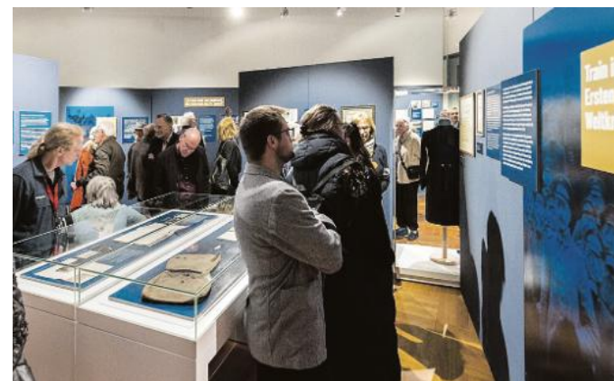
Am 12. Juli findet eine Führung durch „Als die Karlsburg Kaserne war. Das Badische Train-Bataillon Nr. 14 in Durlach“ statt.

Führung durch die Dauerausstellung im Pfnzgaumuseum