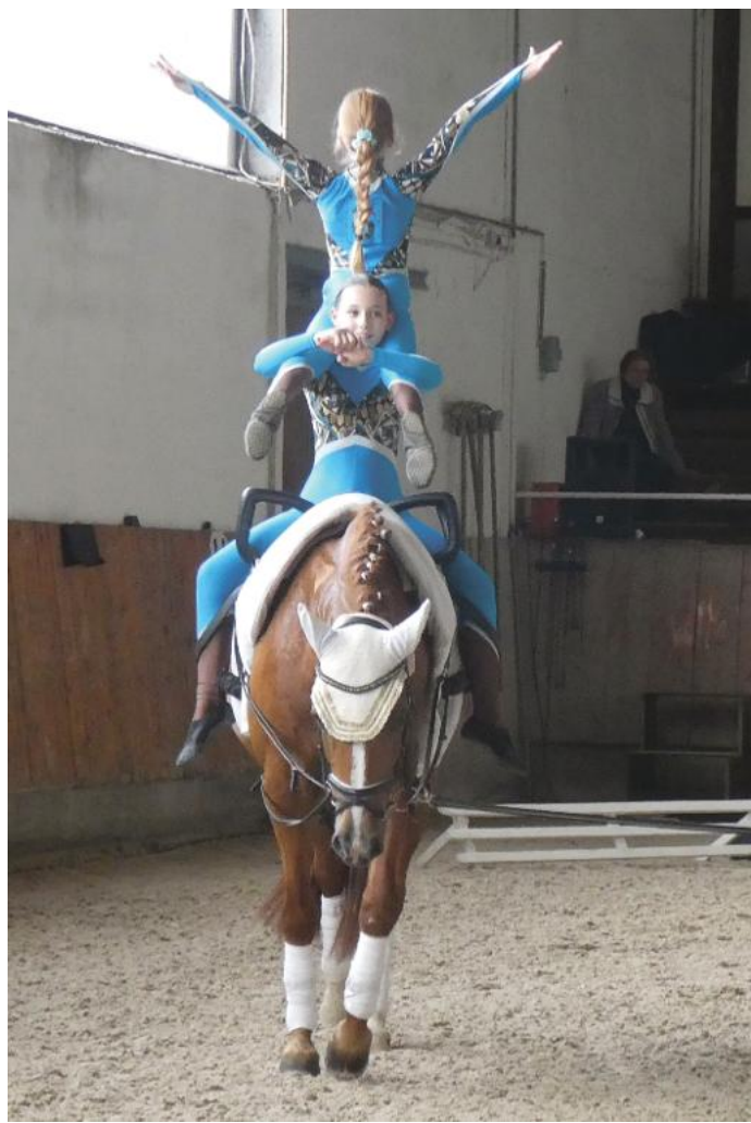
Impression vom Turnier.

Der zweite Turniertag war dem Nachwuchs und dem Breitensport gewidmet. Entsprechend war der Schwierigkeitsgrad der ausgeschriebenen Wettbewerbe im leichten Bereich angesiedelt. So fanden auch Wettbewerbe statt, bei denen das Pferd nicht galoppiert, sondern im Schritt den Voltigierinnen eine leichtere Basis für die Turnübungen bietet. In diesem Wettbewerb war der RV Durlach mit zwei Teams vertreten, die mit den Plätzen zwei und drei erfolgreich waren. Geturnt wurde auf „Ernest“, dem zweiten Voltigierpferd des Durlacher Reitervereins.