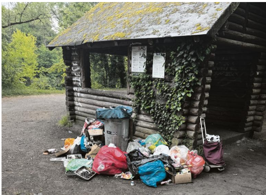
Seit geraumer Zeit dokumentieren die Angler die Missstände, fotografieren die Hinterlassenschaften - und werden dafür bisweilen barsch angegangen.

Angler prangern Missstände an – Stadt spricht von Ausnahmen und ist überfordert