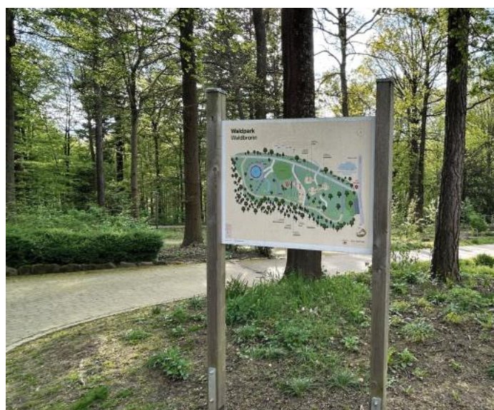
Der bereits bestehende und öffentliche Waldpark neben der SRH-Klinik.

Drei von fünf abgelehnt Vom Antrag der CDU-Fraktion