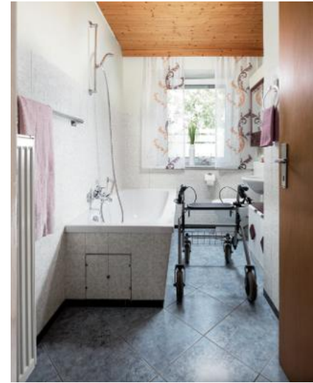
Ein Bad mit Wanne und hohem Einstieg. Der schmale Grundriss lässt eine Nutzung mit Gehhilfe kaum zu.

(akz/red.) Im Laufe des Lebens verändern sich Bedürfnisse - vom Singlehaushalt über die Familienphase bis hin zum Wohnen im Alter. Was einst als ideales Bad galt, entspricht oft nicht mehr den aktuellen Ansprüchen. Eine Teilrenovierung bietet hier eine effiziente und kostengünstige Möglichkeit, den Duschbereich zu modernisieren und den Komfort deutlich zu steigern. Kermi Duschdesign unterstützt dabei mit langjähriger Erfahrung und passgenauen Duschen für jede Lebensphase.