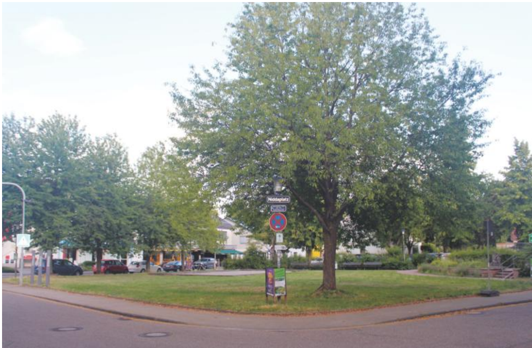
Niddaplatz und Klimawandel sorgten im Ortschaftsrat für lebhafte Debatte.

Große Worte, wenig Durchgriff und ein Platz, auf dem sich alles bündelt