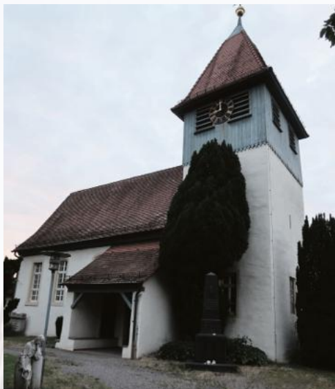
Der Unterhalt für die Jakobuskirche in Wolfartsweier soll künftig von einer Stiftung finanziert werden.

Für Hans-Jürgen Göbert ist sie der Lebensmittelpunkt der Wolfartsweierer