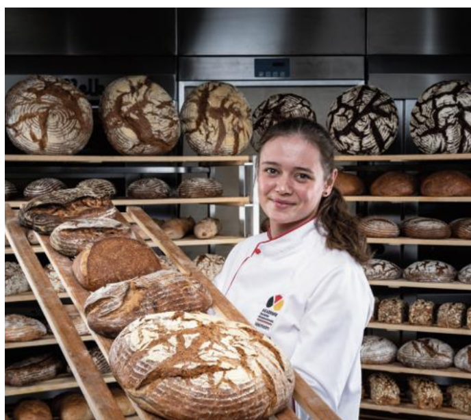
Die Nachfrage nach hochwertigen und regionalen Backwaren vom Handwerksbäcker ist hoch. Und das bedeutet: sichere Arbeitsplätze - unabhängig von Konjunkturschwankungen.

(spp/red.) Der Arbeitsmarkt ist im Wandel: Künstliche Intelligenz wächst rasant und ändert Berufsbilder und macht einige sogar ersetzbar. Doch auch künftig wird es Berufe geben, die unverzichtbar sind - vor allem in der Handwerksbranche. Die Ausbildungsberufe im Bäckerhandwerk gehören dazu. Das zeigen auch die Ausbildungszahlen: Im vergangenen Jahr ist die Zahl der neuen Azubis in den Berufen Bäckereifachverkäufer/in und Bäcker/in um über 10 Prozent gestiegen. Warum sind die Jobs zukunftssicher? „Während viele Jobs angesichts von KI von großen Veränderungen überrollt werden, erweist sich das Bäckerhandwerk als stabiler Ausbildungsweg“, so Nils Vogt, der beim Zentralverband des Deutschen Bäckerhandwerks für das Thema Ausbildung zuständig ist.