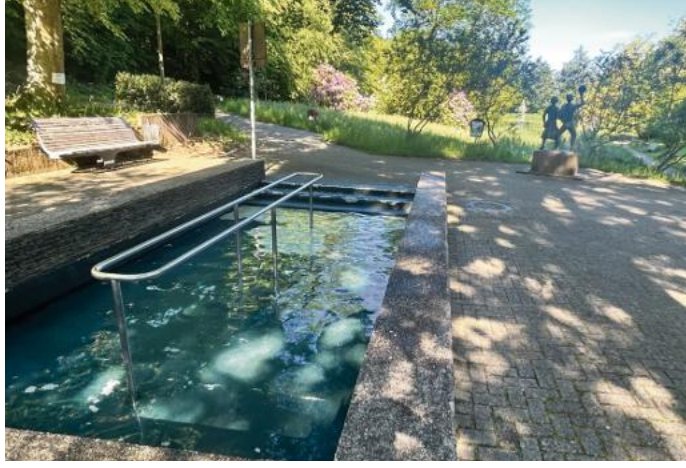
Die Kurtaxe finanziert zum Teil die sogenannten „kurörtlichen Einrichtungen“, die den Gästen und Einwohnern zur Verfügung stehen – wie hier das Kneippbecken im Waldbronner Kurpark.

Ebenfalls zur Kasse gebeten werden sollten Gäste aus den