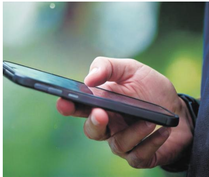
Betrüger geben sich am Telefon als Mitarbeitende der Pflegestützpunkte aus.

Betrüger geben sich als Mitarbeitende von Pflegestützpunkten aus