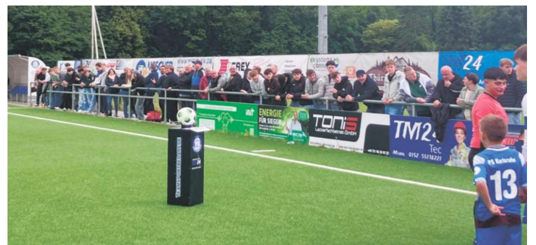
250 Besucher hieß der VfB Grötzingen beim Aufstiegsspiel der A-Junioren willkommen. Bei den Helfern zeichneten sich vor allem die C-Junioren der Gastgeber aus.

Erfreut zeigt sich der Verein laut Pressemitteilung vor allem über den Einsatz seiner Jugendspieler, allen voran den C-Jugendlichen, die bei der