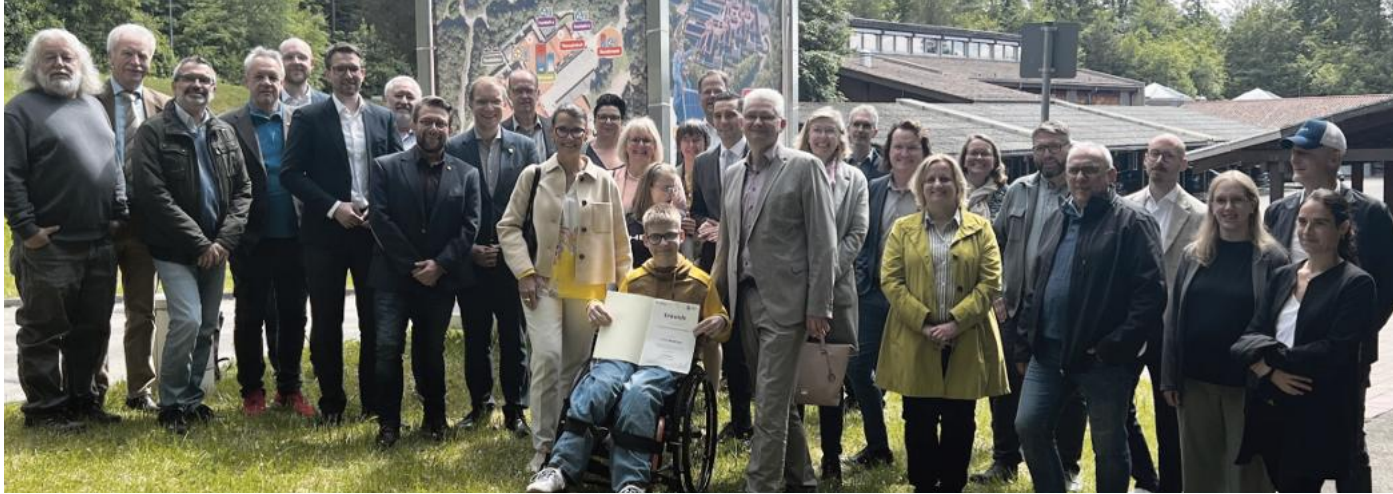
Vertreter des Landratsamts, des Landkreises, der Gemeinde und der Schule freuten sich über den Förderbescheid für das Modellprojekt.

Ludwig-Guttman-Schule freut sich über Förderung des Ministeriums