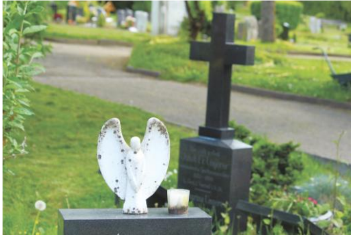
Neue Erinnerungsgärten sollen Friedhöfe in Pfinztal naturnah und einladend gestalten. Urnenfelder wie hier in Berghausen sollen weiterhin bestehen.

(svs/red.) Der Friedhof kann und darf mehr sein als ein stiller Ort der Trauer. Davon zumindest geht der Pfinztaler Gemeinderat aus. Friedhöfe sollen künftig stärker auch Orte der Begegnung, des Innehaltens und des Wohlfühlens werden. So beschloss der Gemeinderat in seiner Sitzung Mitte Mai die Einrichtung sogenannter Erinnerungsgärten in Berghausen, Kleinsteinbach und Wöschbach. Auch in Söllingen soll ein entsprechendes Angebot entstehen.