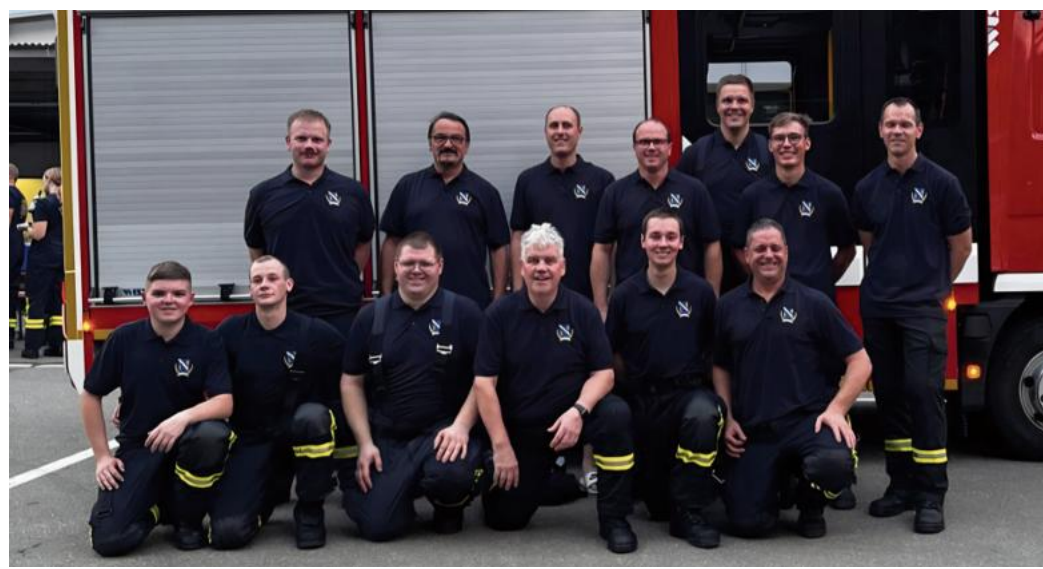
Erreichten ihr gemeinsames Ziel: Die 13 Waldbronner Feuerwehrleute, die das Leistungsabzeichen in Gold nach den neuen Richtlinien erwarben.

„Dies war auch erst das vierte Mal in der Geschichte der Feuerwehr Waldbronn, dass eine Gruppe zur Abnahme des Leistungsabzeichens in Gold antrat“, geht aus der Pressemitteilung hervor. Die Teilnahme der beiden Gruppen unterstreiche nicht nur das hohe Ausbildungsniveau der Waldbronner Feuerwehr, sondern auch deren besonderes Engagement.