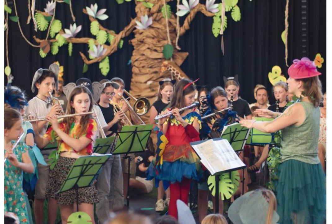
Die Jugendformation des Musikvereins lädt ein zu ihrem dritten Familienkonzert.

(bak/red.) „Es war einmal ...“ – mit diesen Worten stimmt die Märchenerzählerin in ihrem Ohrensessel das Publikum auf eine fantasievolle Reise ein: Beim dritten Familienkonzert des Musikvereins Freundschaft Berghausen (MVFB) am 28. Juni treffen Dornröschen, Zwerge, die Berghausener Stadtmusikanten und viele Märchenfiguren aufeinander.