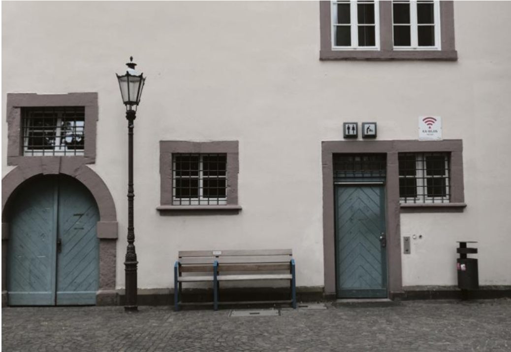
Nicht jeder ist mit den Sitzbänken in Durlach zufrieden.

Anzahl der Sitzbänke ist in den vergangenen Jahren auf 375 gestiegen