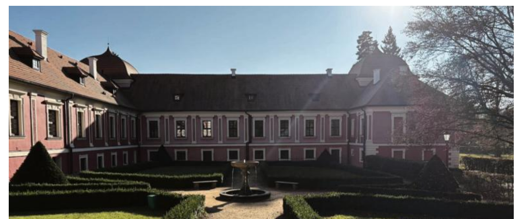
Der badische Einfluss reichte einst bis nach Böhmen: Das Foto zeigt das dortige Schloss Schlackenwerth (Ostrov nad Ohri), das die erste Residenz des „Türkenlouis“ Markgraf Ludwig Wilhelm von Baden-Baden war.

Der Vortrag im Durlacher Rathaus beginnt am Dienstag, 7. Juli, um 19.30 Uhr. Der Eintritt ist frei, Spenden sind willkommen.