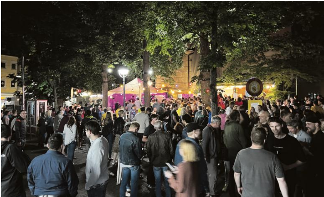
Treffpunkt Meeting-Durlach auf dem Altstadtfest: Am 3./4. Juli ist es wieder soweit.

Warum das Meeting-Durlach seit Generationen das Altstadtfest prägt