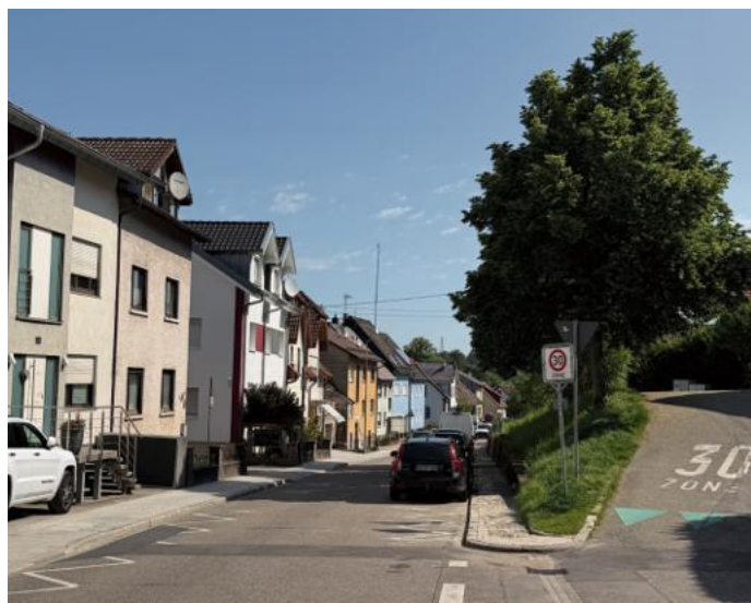
Die Remchinger Straße liegt im Zentrum des Sanierungsbereiches, für den ein Förderantrag gestellt werden soll.

Der Gemeinderat folgt damit der Empfehlung des Bau-, Planungs- und Umweltausschusses, geht aus einer Pressemitteilung der Gemeinde hervor. Den Antrag vorbereiten soll das Büro STEG - Stadtentwicklung GmbH in Stuttgart, das schon die städtebauliche Erneuerungsmaßnahme in Langensteinbach begleitet.