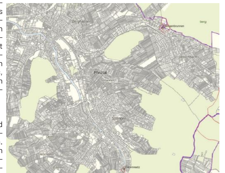
Hier fördert Pfinztal sein Trinkwasser: Aus dem Heiligenbrunnen in Wöschbach und aus dem Dammreetz-Brunnen in Söllingen.

das Wasserschutzgebiet Söllingen nicht mehr vollständig heutigen Anforderungen. Dort wurden in der Vergangenheit lediglich die engeren Schutzzonen ausgewiesen. Eine weiter gefasste Schutzzone III, wie sie heute üblich ist, fehlt dort bislang.