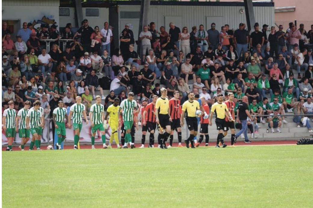
„Zuschauermassen in Lagensteinbach beim entscheidenden Landesliga-Relegationsspiel 1.FC 08 Birkenfeld vs VfB 05 Knielingen (2:4) am 14. Juni - im Karlsruher Amateurfußball ein eher seltenes Bild.“

Fußballexperte Wolfgang Schmitt zieht eine ernüchternde Saison-Bilanz