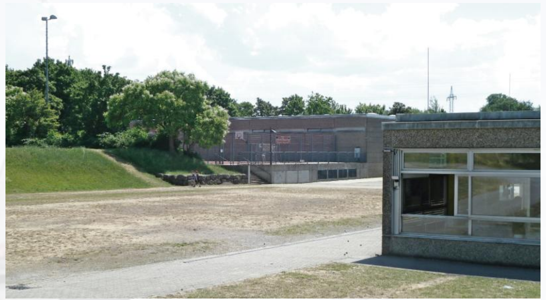
Multifunktionsplatz Grünwettersbach

Ob die stationäre Jugendverkehrsschule mit einem Investitionsbedarf von 500.000 Euro gebaut wird, entscheidet letztlich der Karlsruher Gemeinderat, je nach Finanzlage. Bei der Befragung der weiteren Karlsruher Ortschaftsräte hat sich erwartungsgemäß kein Gremium gegen eine weitere Jugendverkehrsschule ausgesprochen, solange es nicht den eigenen Ort belastet. Man werde die Kin-